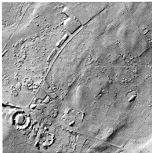
Marie Velardi - Vue 5 (cratère), 2006, Photographie noir/blanc, 70 x 70 cm, édition de 5 ex.

Cette jeune plasticienne explore les notions de futur et d'utopie, notamment à travers des visions de Genève à venir : Genève envahie par la végétation, Genève traversée de nacelles aériennes, Genève convertie aux énergies renouvelables. Des perspectives qui rejoignent celles du Belge Luc Schuiten, récemment exposé à la Maison d'Ailleurs. L'artiste retrace aussi l'histoire du XXIème siècle à l'aide de textes de romans et de films d'anticipation, illustrés de créations originales.