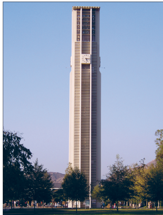
La tour de l'université de Riverside